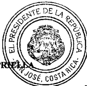
ABEL PACHECO DE LA ESPRIELLA